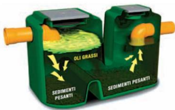
Kleinkläranlagen, Öl- Fett- und Sandabscheider